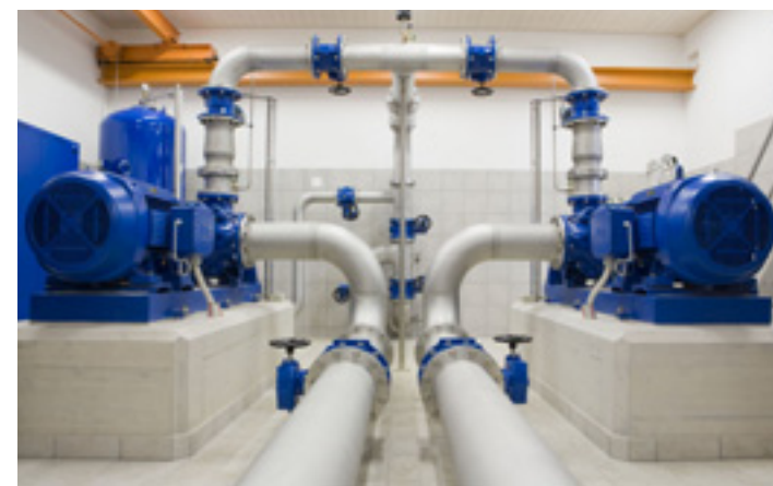
Das Grundwasserpumpwerk «Strandbad» in Uster wurde im Jahr 2007 komplett erneuert.

... regelmässig reichlich Wasser zu trinken, denn Trinkwasser ist ein exzellenter Durstlöscher. Es ist von hoher Qualität, erfrischend, gesund und unschlagbar im Preis. Trinkwasser ist vielen Mineralwässern ebenbürtig, benötigt zu seiner Bereitstellung aber bis zu tausendmal weniger Energie.