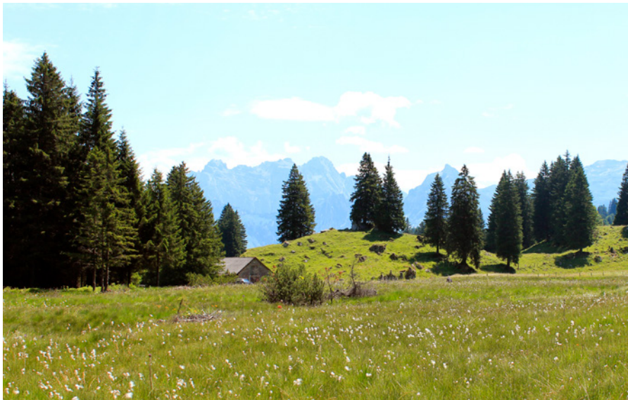
Hochmoor im Schwändital

Eines der zahlreichen nationalen CO 2 -Kompensationsprojekte unterstützt die Renaturierung von Hochmooren. Durch diese Wiedervernässung gelangt nicht nur weniger Treibgas in die Atmosphäre. Zusätzlich werden auch Biodiversität und der natürliche Wasserhaushalt gefördert. Als weiteres CO 2 -Kompensationsprojekt fördern wir die klimaoptimierte Bewirtschaftung von Schweizer Wäldern, damit CO 2 gespeichert werden kann. Entsprechend werden CO 2 -Kompensationsprojekte kontinuierlich gefördert und ausgebaut.